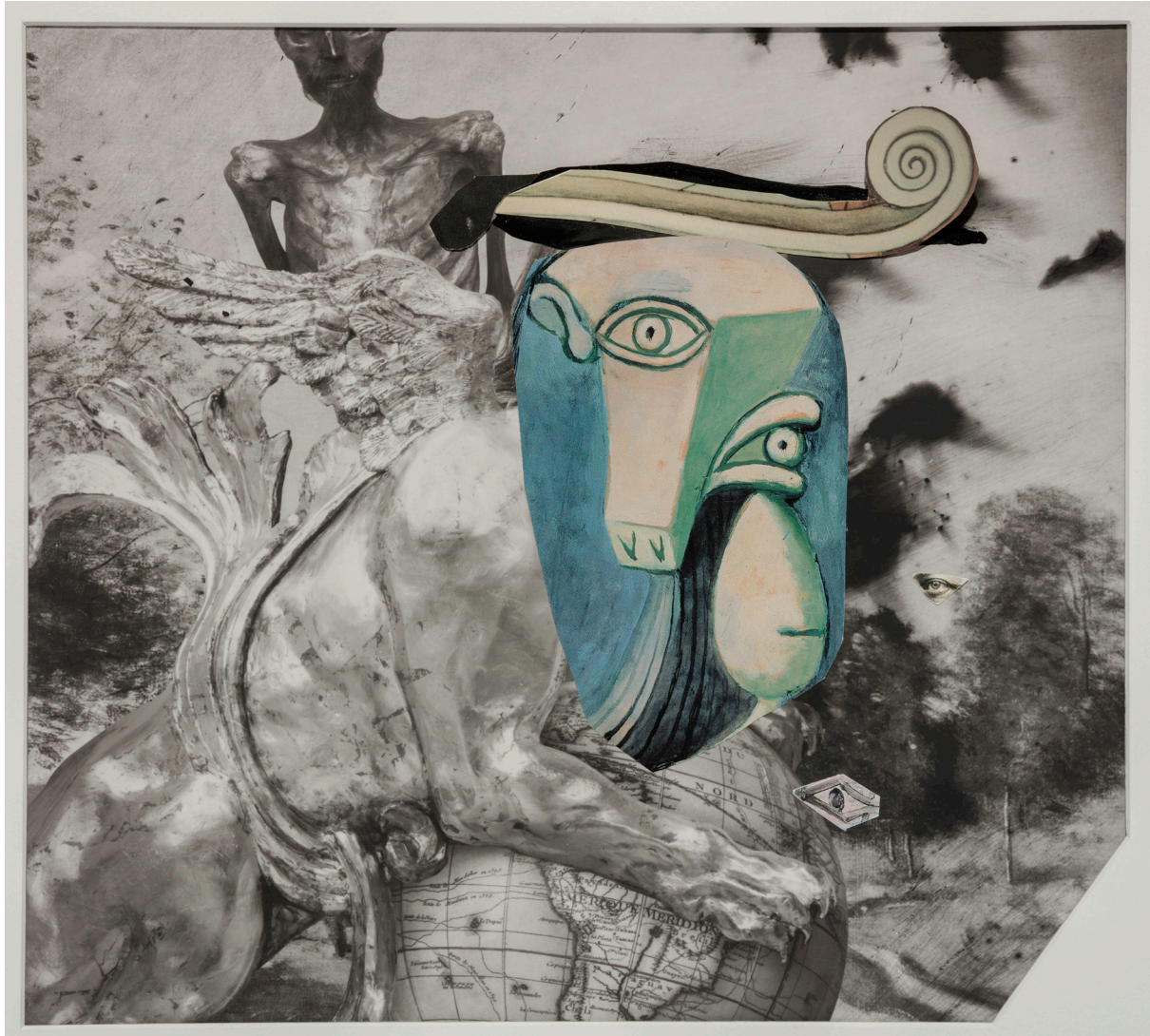
Picasso In Purgatory, New Mexico, 2015, Painted © Joel-Peter Witkin - courtesy baudoïn lebon

/// vernissage 19 avril 2017 de 18h à 21h exposition du 20 avril au 3 juin 2017