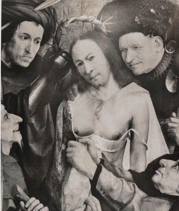
Woman Christ, New Mexico, 2014 © Joel-Peter Witkin - courtesy baudoin lebon