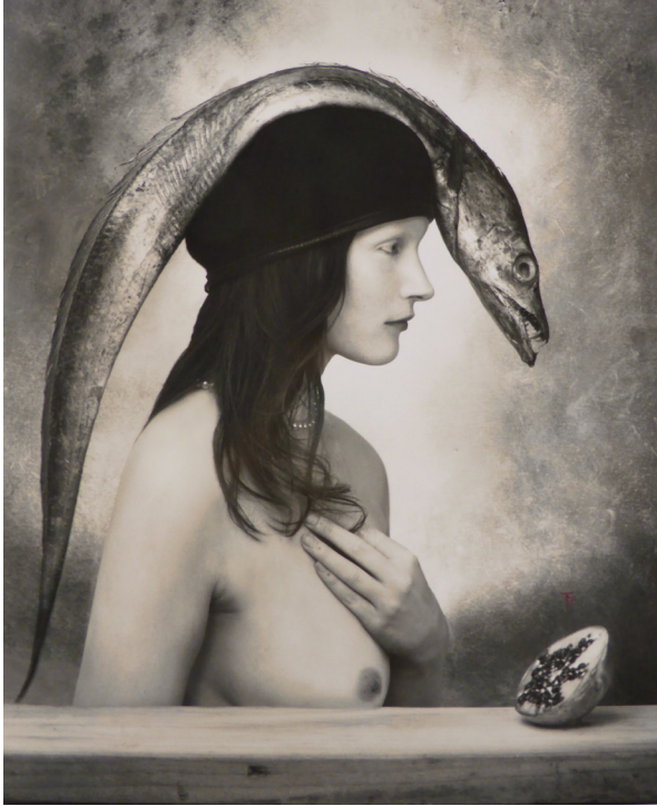
Imperfect Thirst, New Mexico, 2016