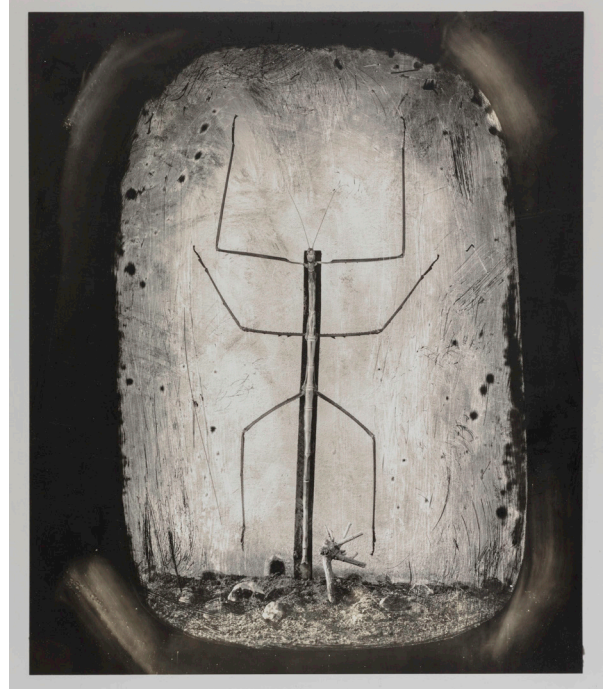
Insects Reenacting The Crucifixion, New Mexico, 2015 © Joel-Peter Witkin - courtesy baudoin lebon