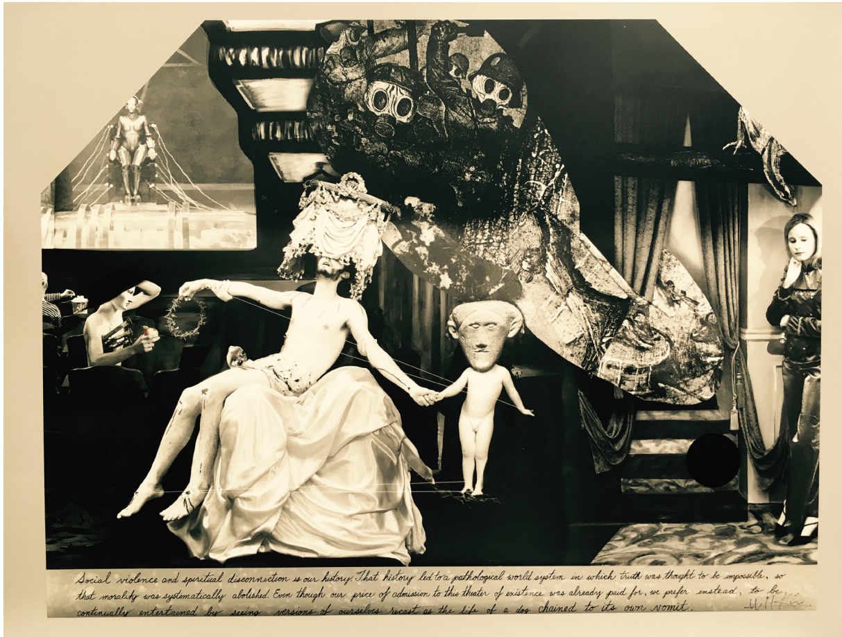
Hopper's Movie As The Theatre Of Existence, New Mexico, 2017