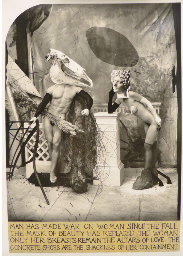
MAN HAS MADE WAR ON WOMAN SINCE THE FALL THE MASK OF BEAUTY HAS REPLACED THE WOMAN ONLY HER BREASTS REMAIN THE ALTARS OF LOVE. THE CONCRETE SHOES ARE THE SHACKLES OF HER CONTAINMENT.