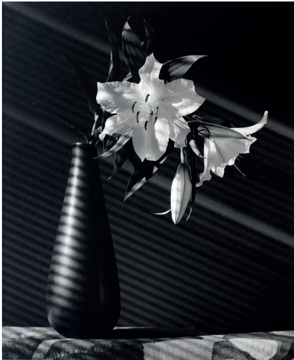
Robert Mapplethorpe, Lily, 1987 Tirage argentique, 58,5 x 48 cm, éd. 5/10 Courtesy baudoin lebon

AUTRES VISUELS DISPONIBLES POUR LA PRESSE