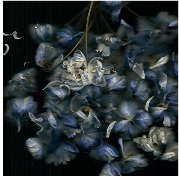
Mathilde Nardone, Zorah, 2017 Papier mat contrecollé sur aluminium, 90 x 90 cm

Les charmes du Géant, Espace Saint Bernard, Bruxelles, BE