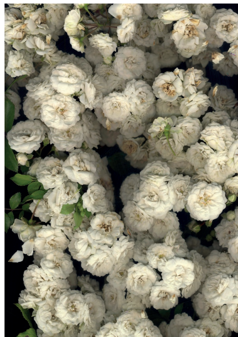
Mathilde Nardone, Terril 3, 2016 Papier mat contrecollé sur aluminium, 165 x 120 cm