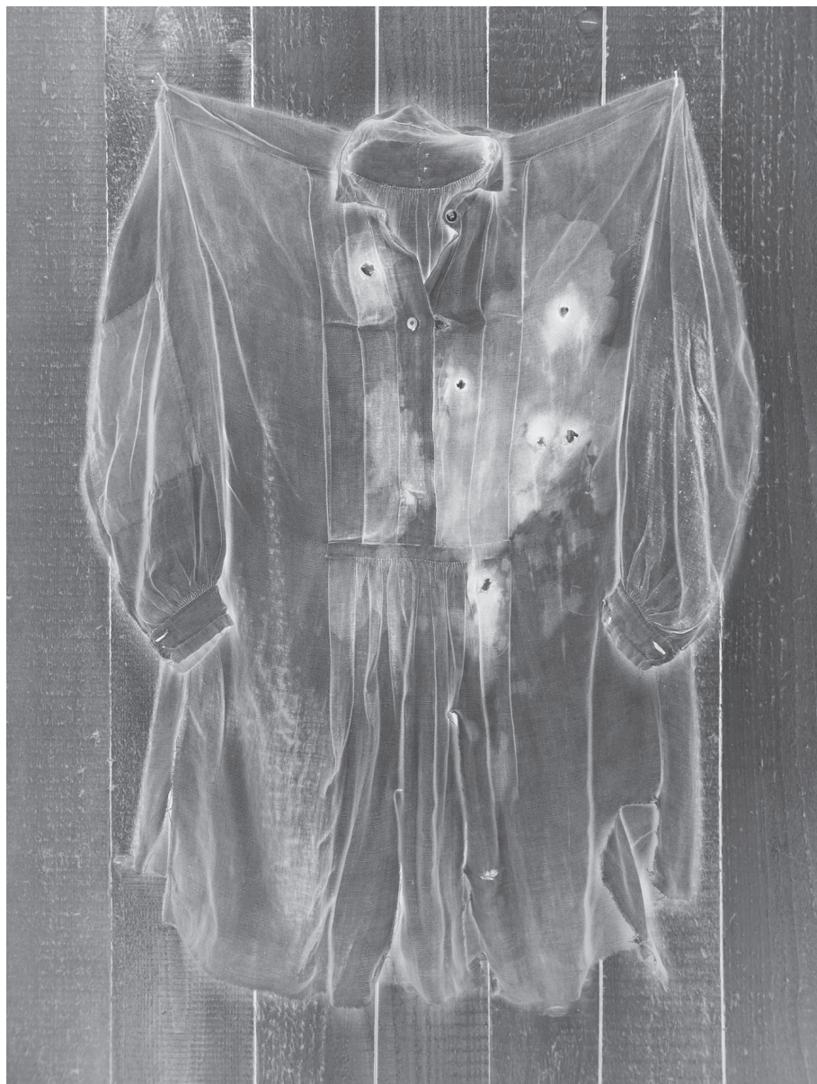
< couv.: Patrick Bailly-Maître-Grand, Rocking Chair , 2003, 7 éléments 60 x 60 cm. Épreuves au chlorobromure d'argent avec virage. Marouffés sur aluminium.