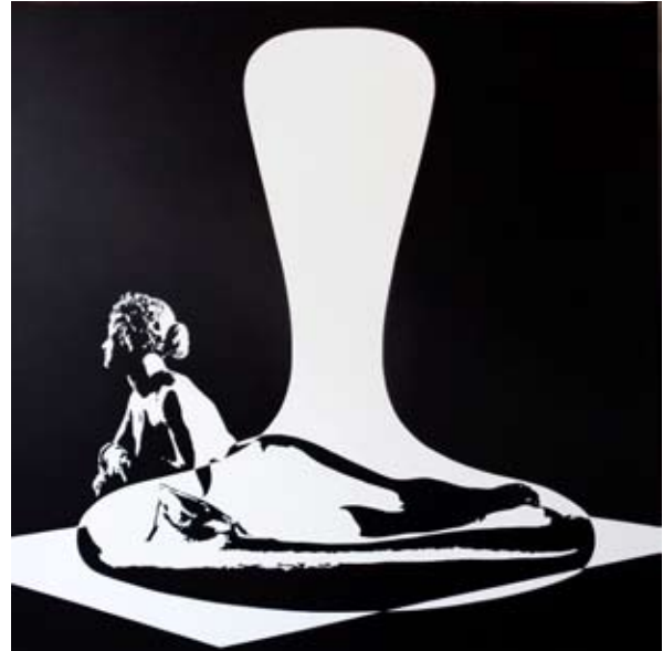
Ça n'a aucune importance ou Comme je m'en tamponne , 150 x 150 CM, acrylique sur toile, 2015