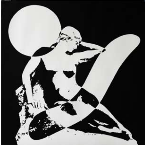
L'amande et la limace , 80 x 80 cm, acrylique sur papier, 2014