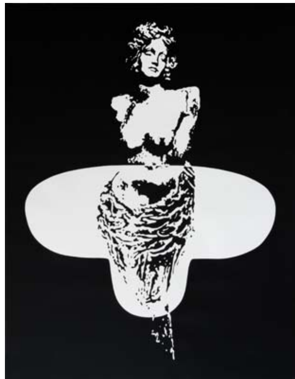
Descente d'un fleuve tranquille , 100 x 80 cm, acrylique sur papier, 2014