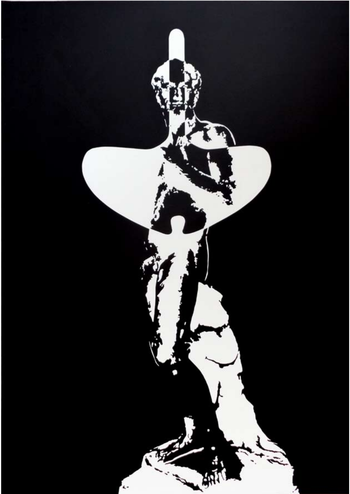
Descente d'un fleuve tranquille, 100 x 80 cm, acrylique sur papier, 2014