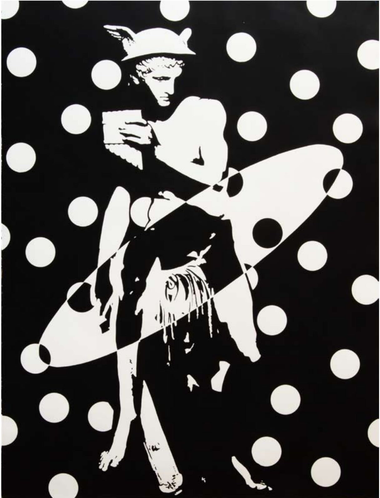
Le postier en pleine révolution des planètes, 100 x 80 cm, acrylique sur papier, 2014