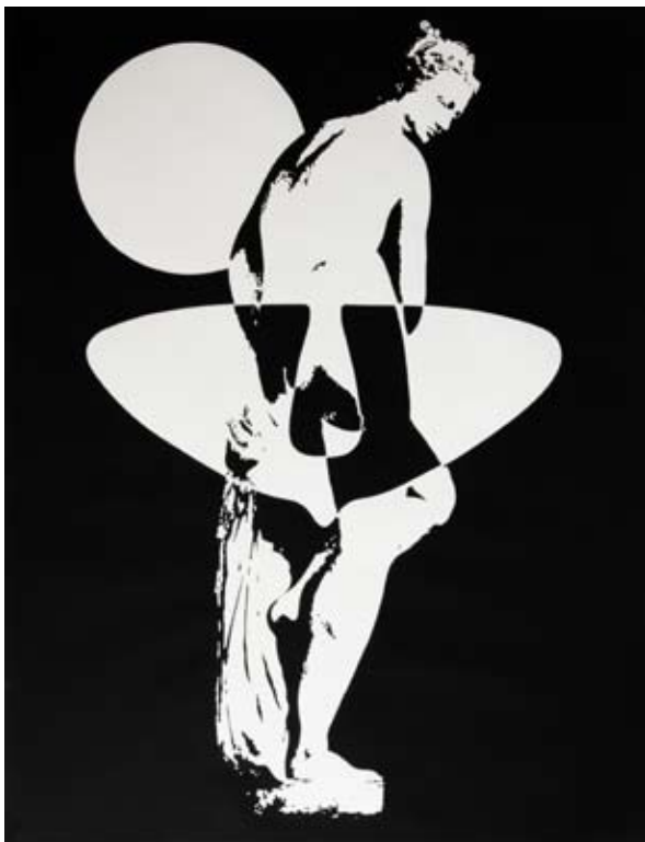
Bain de minuit près du saint siège , 135 x 100 cm, acrylique sur papier, 2014

La vidéo Amour Électrique est disponible sur demande : m.chanteperdrix@baudoin-lebon.com