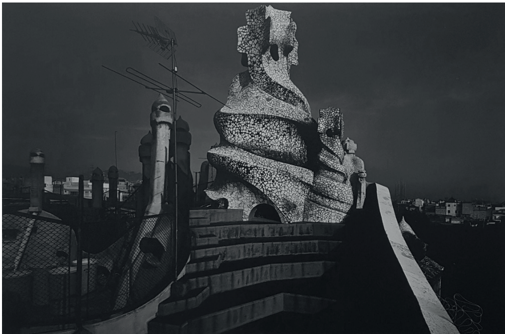
Casa Mila, 1977-78 - tirage gélatino-argentique vintage, 60 x 90 cm