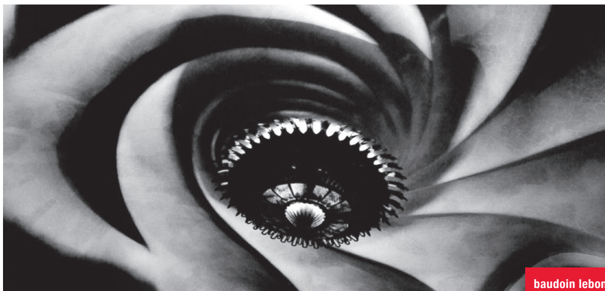
Casa Battlo 123, 1979 - tirage argentique vintage, 59,8 x 74,8 cm