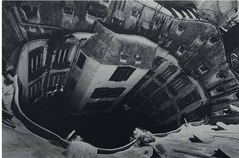
Casa Mila 7, 1977 - tirage gélatino-argentique vintage, 60 x 89,8 mm

De 1957 à 1961, il forme avec les photographes Shomei Tomatsu, Ikko Narahara, Kikuji Kawada, Akira Sato et Akira Tanno, le collectif VIVO qui crée le mouvement «École de l'image» dont l'ascendant marquera le style photographique japonais des années 60 et 70.