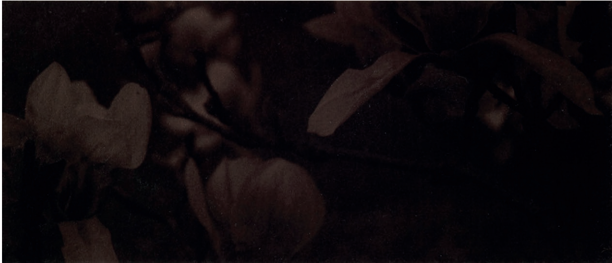
Vicky Colombet, série 'Light into Night' #01, impression jet d'encre sur Photo Rag Metallic, 11 x 14,5 cm, 2020