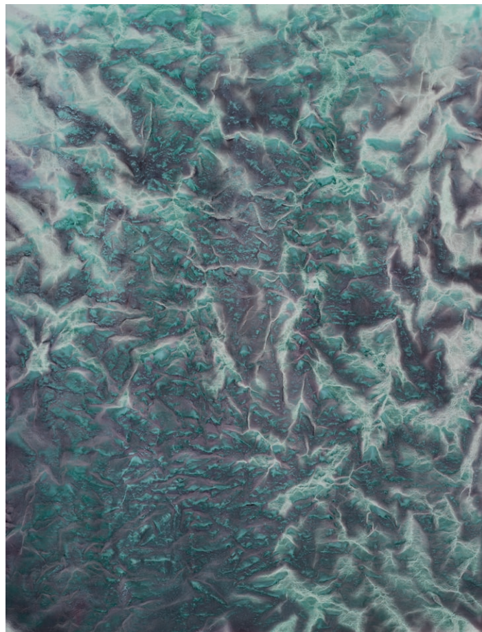
Vicky Colombet, 'Promenade' #1428 huile, pigments et alkyde sur toile, 99.6 x 76.2 cm, 2019 Courtesy de l'artiste et baudoïn lebon