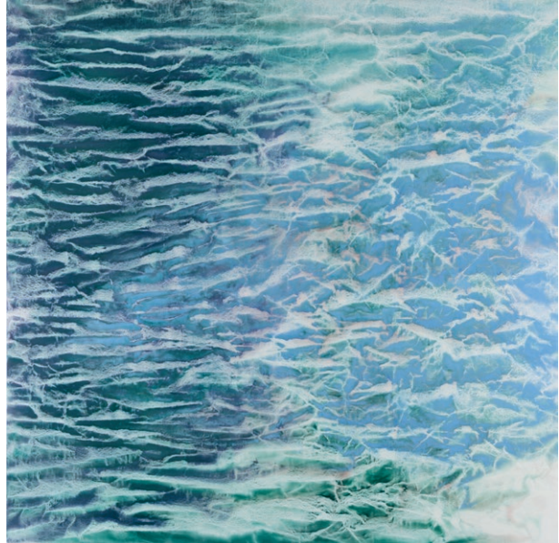
Vicky Colombet, série 'From the floating world' #1437, pigments, huile et alkyde sur toile, 91 x 93 cm, 2020

baudoin lebon is pleased to present the first solo show of Vicky Colombet: "From the Floating World" at its Paris gallery (April 22-June 20, 2020) in conjunction with her exhibition, dialogue with Monet at the Musée Marmottan-Monet for the 3rd opus of "The Unexpected Dialogues" (April 28-October 25, 2020).