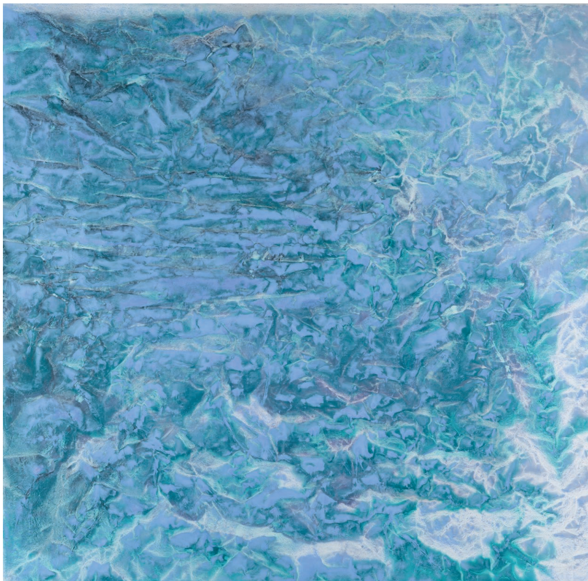
Série 'From the floating world' #1431, pigments, huile et alkyde sur toile, 91 x 93 cm, 2020 Courtesy de l'artiste et baudoïn lebon

23 avril - 20 juin 2020 vernissage le mercredi 22 avril de 18h à 21h