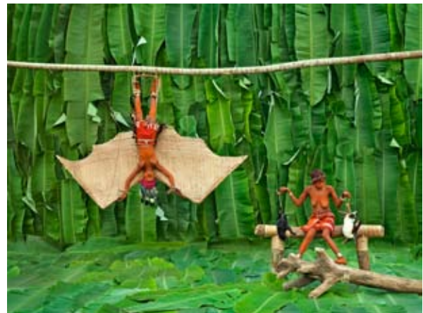
Les biens de Walé Lokito, I am Walé Respect Me, 2013, tirage jet d'encre pigmentaire de qualité archivale sur papier 100% coton, 109 x 145 cm