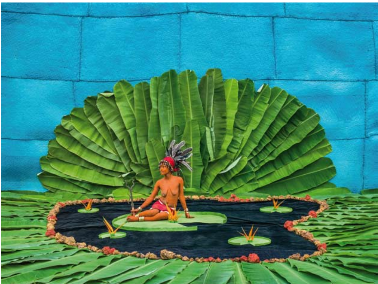
L'étang de Walé Bontongu, forever Walé, 2014, tirage jet d'encre pigmentaire de qualité archivée sur papier 100% coton, 109 x 145 cm

Cette série est le reflet d'un regard extrêmement personnel que l'artiste porte sur les femmes et le rituel Walé, mais aussi le résultat d'une collaboration unique avec des jeunes femmes pygmées, leur clan, et un photographe.