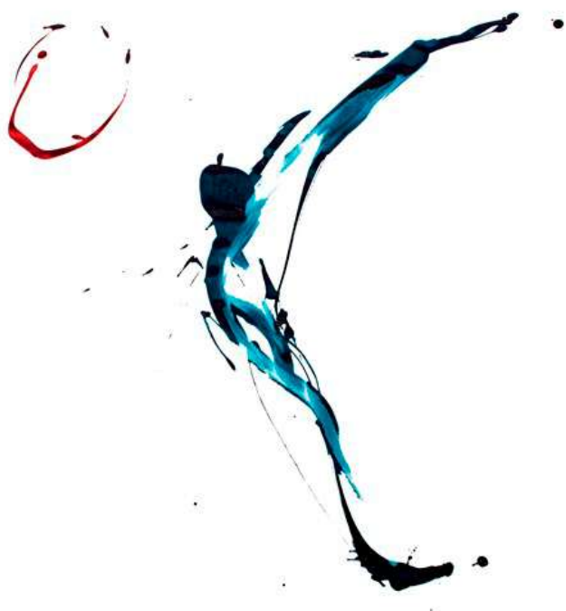
Karen FARKAS E17 sans titre, 2017 Encre sur papier 65 x 50 cm œuvre unique N° Inv. BL46823