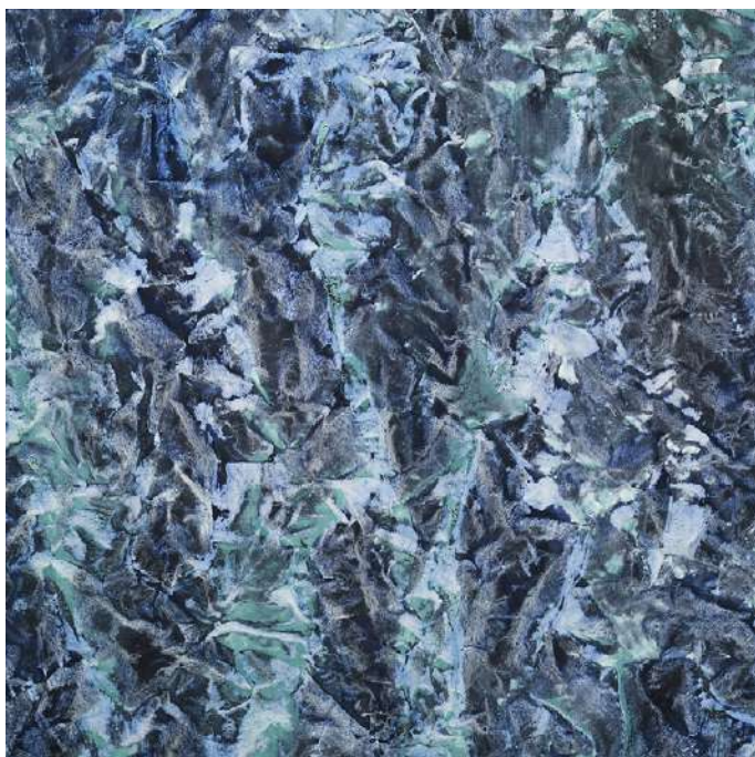
Vicky COLOMBET Détail, Glycine #1417-10, 2019 Huile, pigments, alkyde sur toile 182,8 x 182,8 cm, œuvre unique