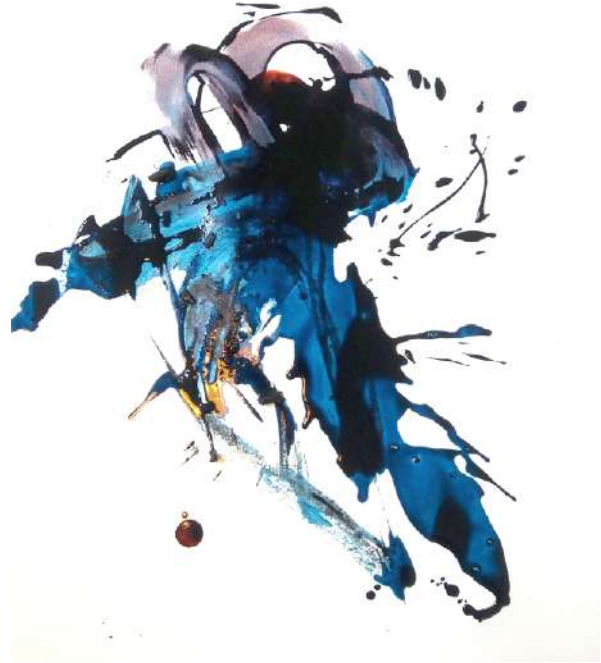
Karen FARKAS 26 mars 2020, 2020 encre et fusain sur papier 50 x 32 cm, œuvre unique N° Inv. BL48826