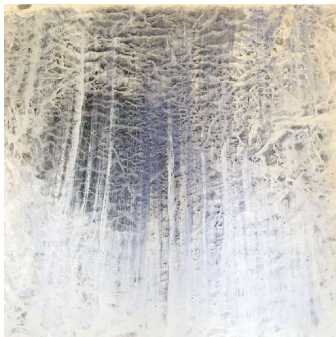
Vicky COLOMBET Waterfall #1369, 2017 Pigments, huile, alkyde sur toile 157,48 x 162,56 cm œuvre unique N° Inv. BL47579