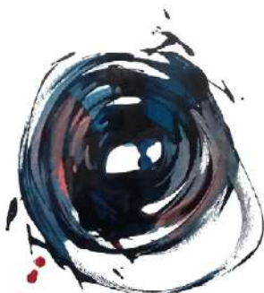
Karen FARKAS, 3 avril 2020, 2020, encre et fusain sur papier, 42 x 31,5 cm œuvre unique, N° Inv. BL48827