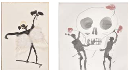
1. Peter Knapp , « L'ange avec une fleur noire », 1998 Lavis d'encre de Chine et collages de plastique jaune et de plumes sur papier, 47,9 x 31,7 cm

LISTE DES VISUELS TÉLÉCHARGEABLES SUR LE SITE WWW.MUSEES.STRASBOURG.EU