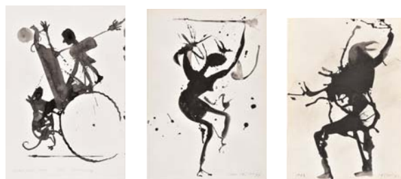
9. Peter Knapp , « Le tout petit cirque », 1995

© Peter Knapp. Photo : Musées de la Ville de Strasbourg / Mathieu Bertola