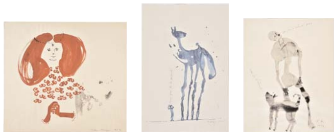
5. Peter Knapp , sans titre (portrait de femme en rouge), 1952

© Peter Knapp. Photo : Musées de la Ville de Strasbourg / Mathieu Bertola