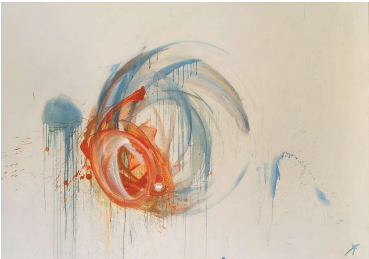
Hommage à Stendhal 2019, Huile sur toile 162 x 114 cm