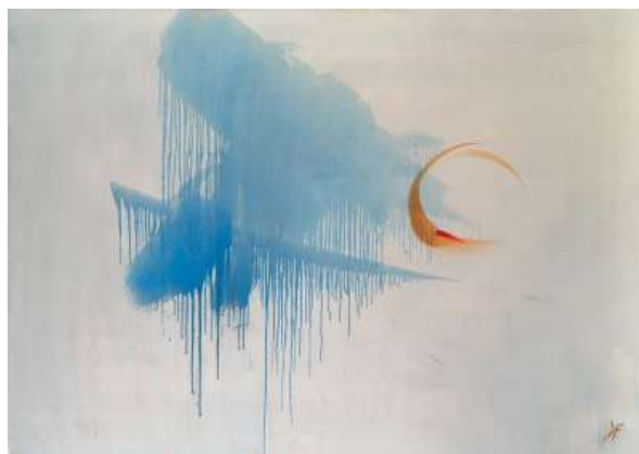
Karen Farkas Côme , 2019, Huile sur toile, 114 x 162 cm © Bertrand Huet/tutti courtesy baudoin lebon