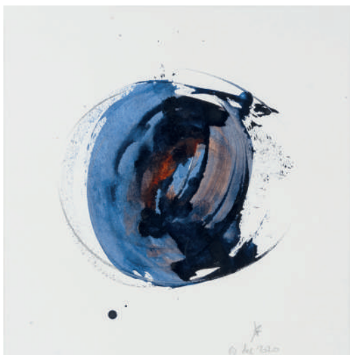
Karen Farkas 28 décembre 2020 , encre et fusain sur papier, 29 x 29 cm