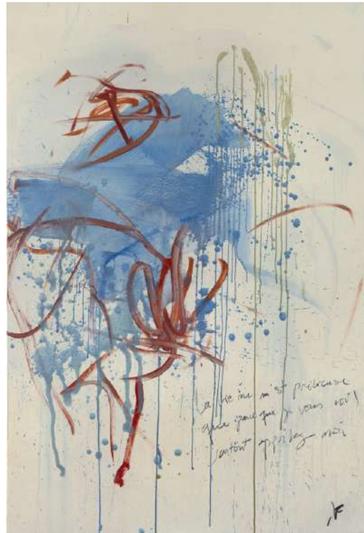
La vie ne m'est précieuse... , 2022, huile sur toile, 146 x 97 cm