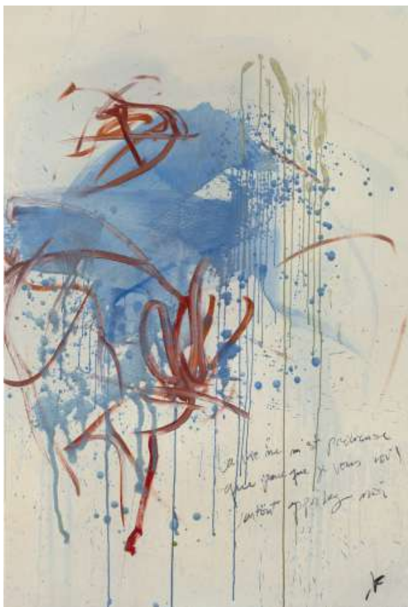
Karen Farkas La vie ne m'est précieuse... , 2022 huile sur toile, 146 x 97 cm