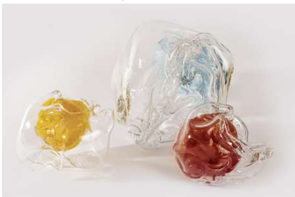
Karen Farkas série Les Inaccessibles , 2022, sculptures en verre soufflé à la volée