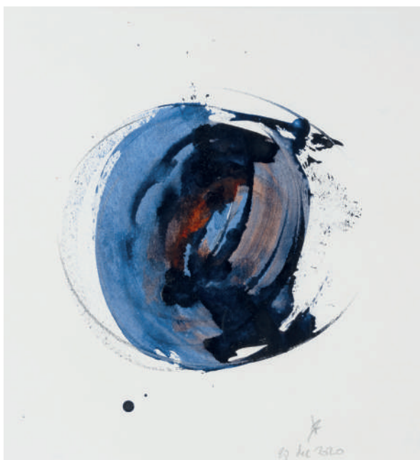
28 décembre 2020, encre et fusain sur papier, 29 x 29 cm