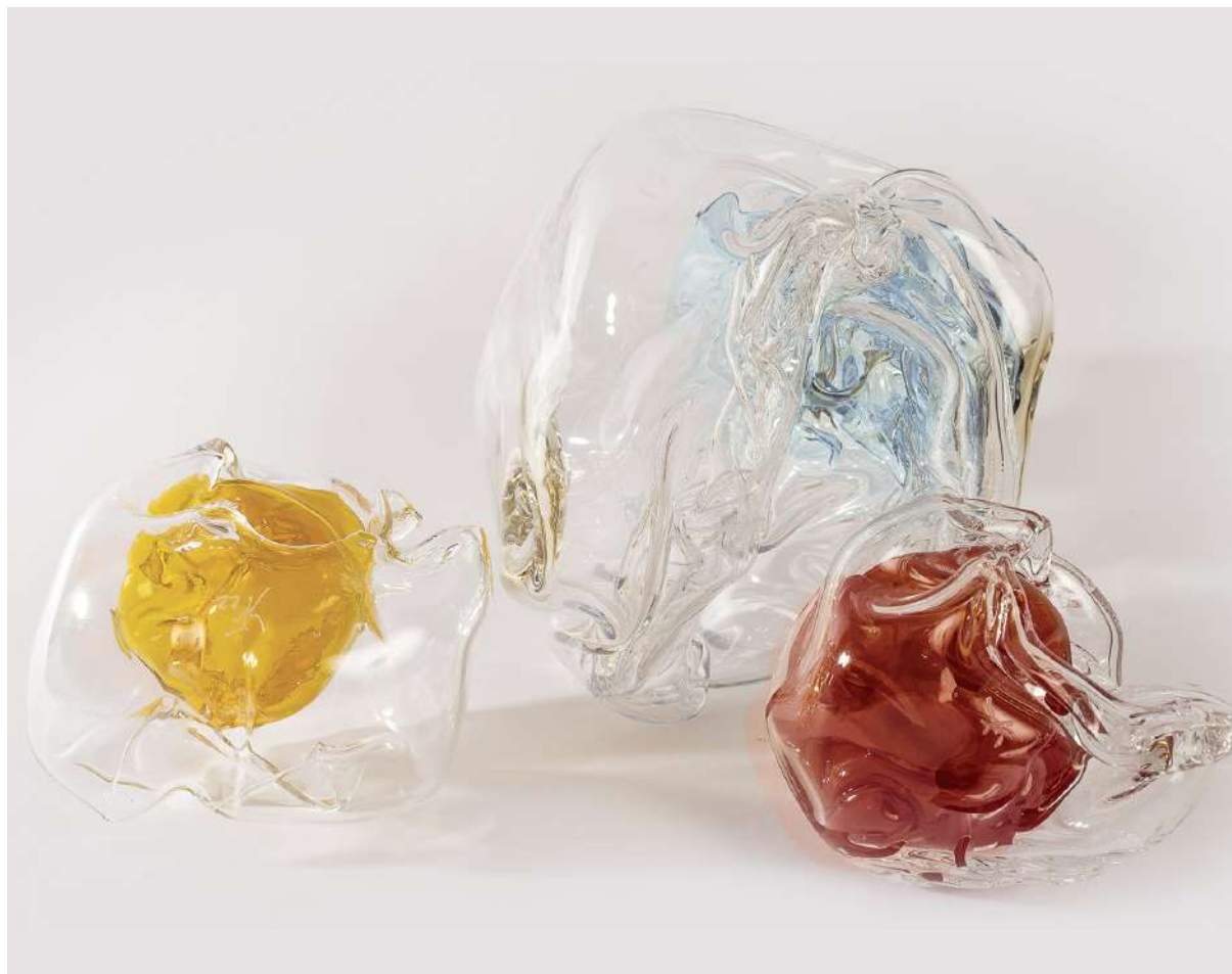
Karen Farkas, Les Inaccessibles , 2022, sculptures en verre soufflé à la volée

/// vernissage mercredi 30 novembre de 18h à 21h