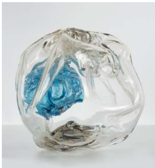
Karen Farkas Inaccessible , 2022 série Les Inaccessibles , verre soufflé à la volée, 15 x 13 cm, unique