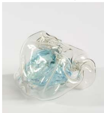
Karen Farkas Inaccessible , 2022 série Les Inaccessibles , verre soufflé à la volée, 18 x 16 cm, unique