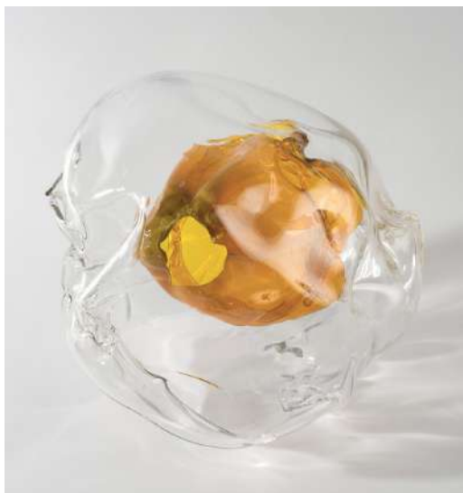
Karen Farkas Inaccessible , 2022 série Les Inaccessibles , verre soufflé à la volée, 25 x 25 cm, unique