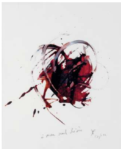
Karen Farkas 15 septembre 2022 , encre et fusain sur papier, 2022, 28 x 24 cm