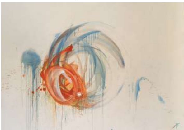
Karen Farkas Hommage à Stendhal , 2019, Huile sur toile 114 x 162 cm