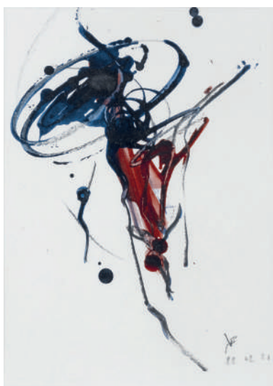
Karen Farkas 22 février 2021 , encre et fusain sur papier, 2021, 24 x 18 cm