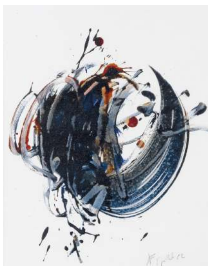
Karen Farkas 5 juillet 2002 , encre et fusain sur papier, 26 x 21 cm