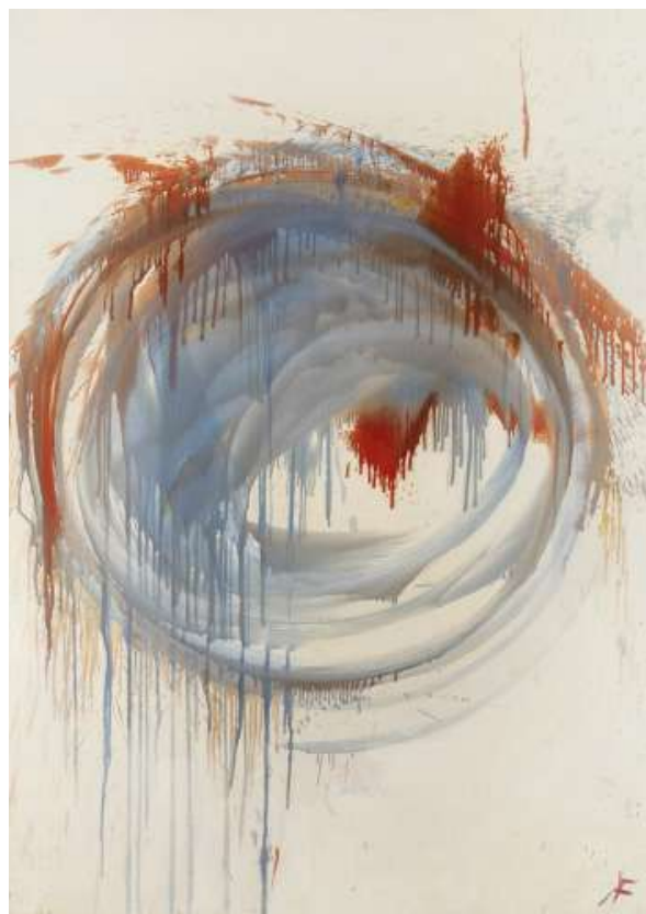
Karen Farkas Côme , 2021, huile sur toile, 162 x 114 cm