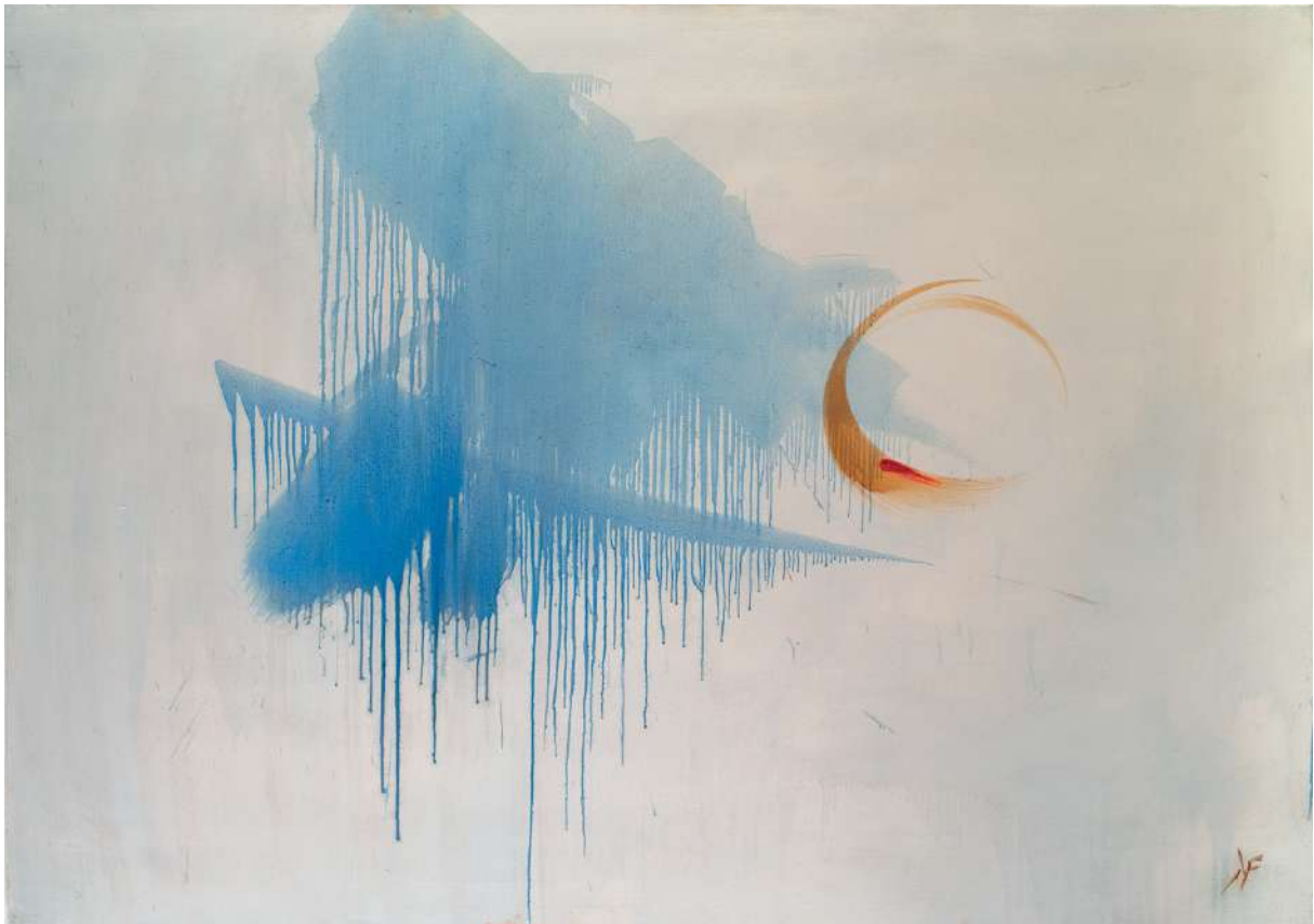
Karen FARKAS, Côte , 2019, Huile sur toile, 114 x 162 cm